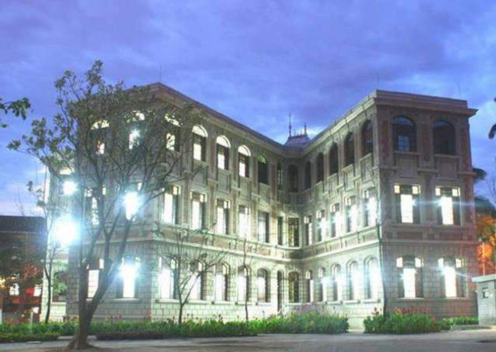
Facultad de Medicina - Universidad de Antioquia